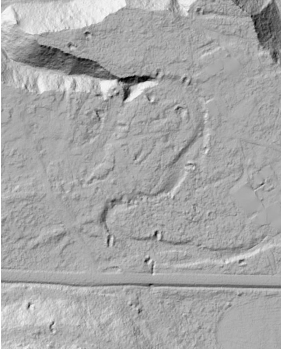
Krigsminner i planområdet