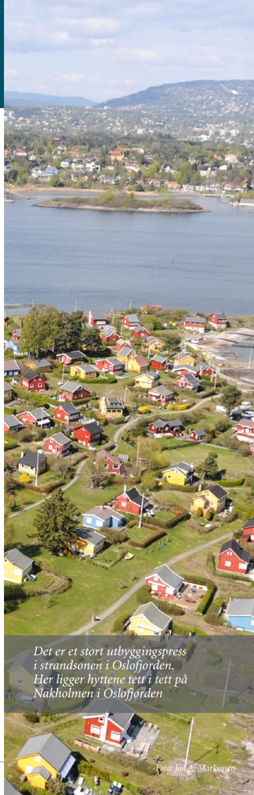
Det er et stort utbyggingspress i strandsonen i Oslofjorden. Her ligger hyttene tett i tett på Nakholmen i Oslofjorden

For å sikre en demokratisk beslutningsprosess og ivareta alle hensyn og interesser, må kommunen vurdere om tiltaket bør fremmes i form av en reguleringsplan. Et tiltak som har vesentlig virkning for miljø og samfunn, bør behandles gjennom en planprosess (kommuneplan eller reguleringsplan). Dersom kommunen kommer til at tiltaket omfattes av en reguleringsplikt, er dette et selvstendig avslagsgrunnlag for dispensasjonssøknaden.