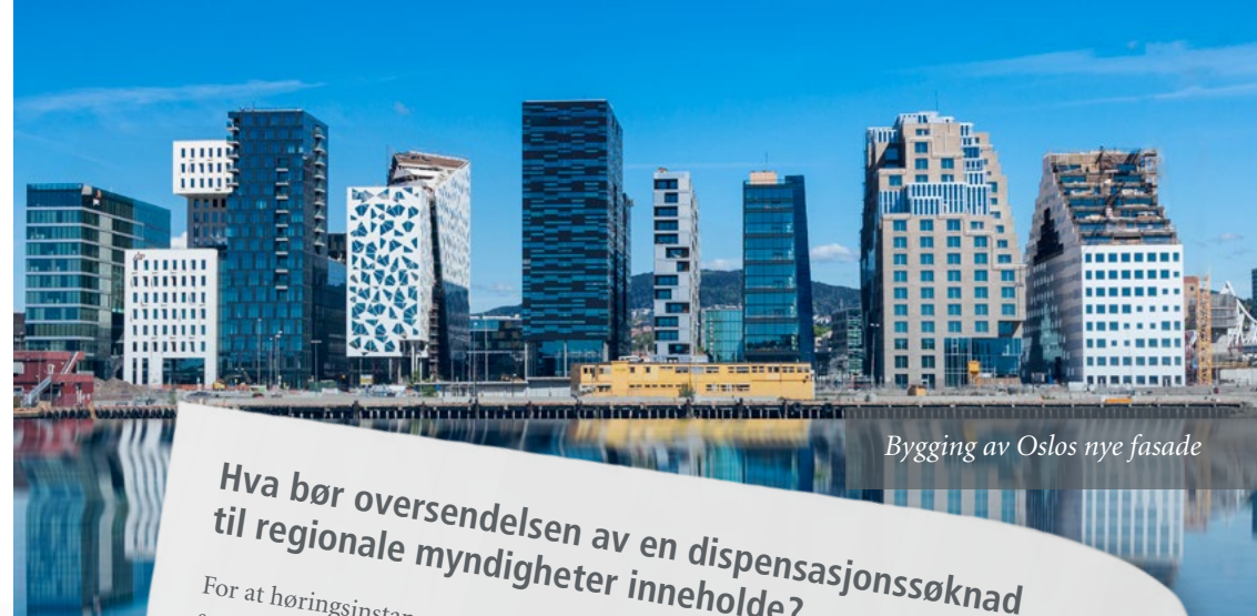
Bygging av Oslos nye fasade

Det at et offentlig organ gir en uttalelse i negativ eller positiv retning innebærer imidlertid ikke automatisk at dispensasjonssøknaden må avslås eller godkjennes, men uttalelsen skal tillegges særlig vekt ved kommunens dispensasjonsbehandling.