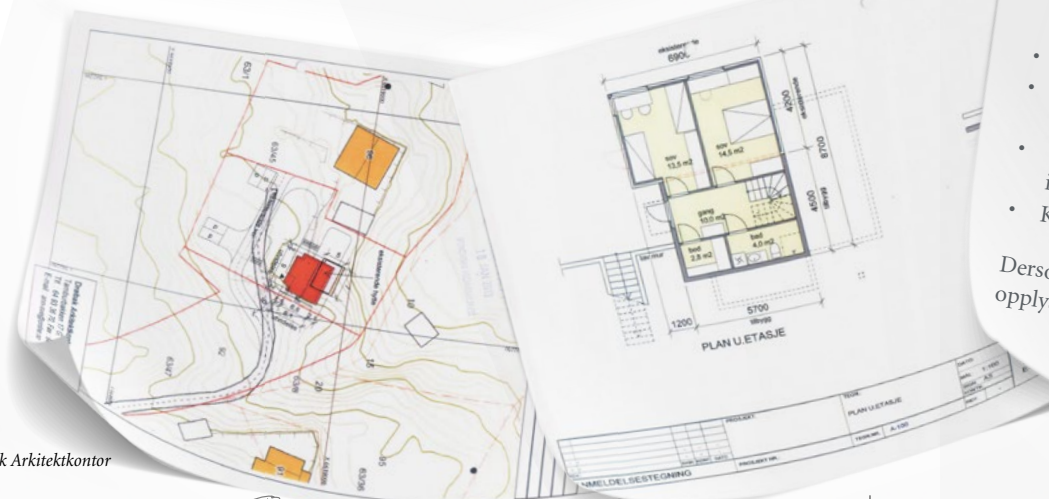
Tegn: Drøbak Arkitektkontor