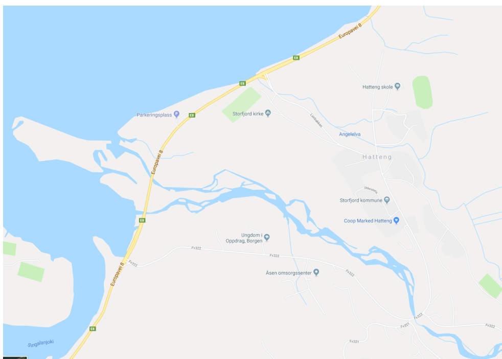
Figur 2. Oversikt over den eksisterende infrastruktur og de viktigste funksjonene på Hatteng. (maps.google.com)