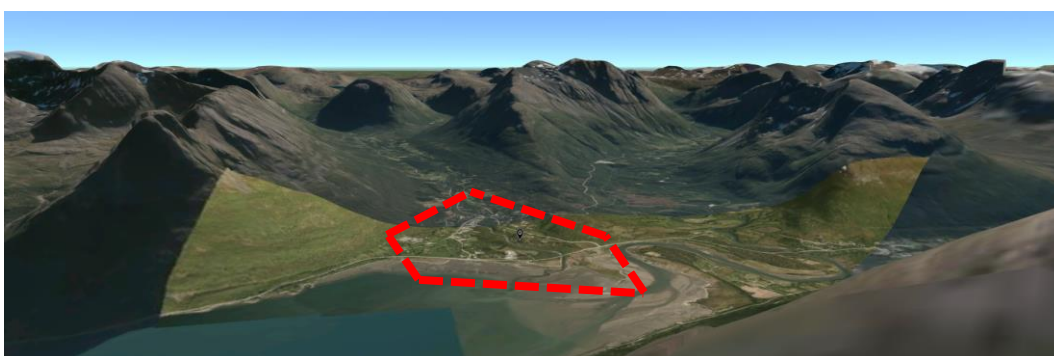
Figur 1. Hatteng er omgitt av mektige fjell. Planområdet markert med rød stiptet linje.

Omgivelsene rundt planområdet preges av mektig natur med skog, fjor og høye fjell med topper over på 1000 meter som Hattefjellet, Mannfjellet, Otertind, Oteraksla og Bogefjell.